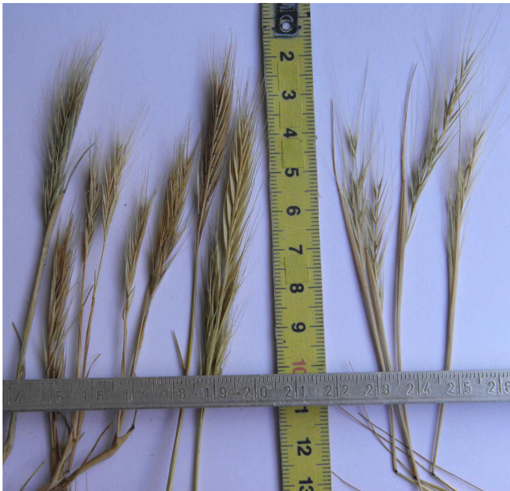
Vulpia Monachne : inflorescence dense, ovaire à brosse ; règle ; inflorescence lâche, ovaire sans brosse (juin 2025)

Camus Aimée 1943- Le genre Vulpia Link dans la flore française. Notulae Systematicae 11: 124-132.