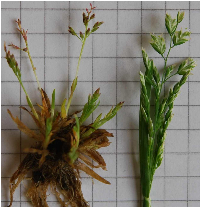
Groupe "annua" : Ex. de Poa infirma "rouge" et annua "vert"

CHICOUENE D. 2021 - Distinction morphologique entre Poa annua L. et Poa infirma Kunth (Gramineae) : observations dans le Massif Armoricain et environs. [Morphological distinctions between Poa annua L. and Poa infirma Kunth (Gramineae): observations in the Armorican Massif and neighbouring areas.] Evaxiana (Société Botanique du Centre Ouest) 8 : 37-48. ( http://www.sbco.fr/articles-evaxiana/08/CHICOUENE%20D.,%202021%20-%20Distinction%20morphologique%20entre%20Poa%20annua%20L.%20et%20Poa%20infirma%20Kunth%20(Poaceae)%20-%20observations%20dans%20le%20Massif%20armoricain%20et%20environs%20-%20Evaxiana%208,%202037%20-%202048.pdf ) ou ( http://dc.plantouz.chez-alice.fr/Evaxiana8DChicouene2021DistMorphoPoaannuainfirma.pdf )