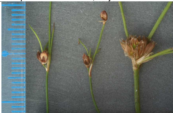
échelle ; J. supinus alpha (2 échantillons); beta (1 échantillon)

cf descriptions in ERICA (1996) n° 8:57-58. Parfois quelques intermédiaires. Le nombre d'E est difficile pour plusieurs raisons, parfois en partie mal formées ; majorité de fleurs à 6 E chez alpha.