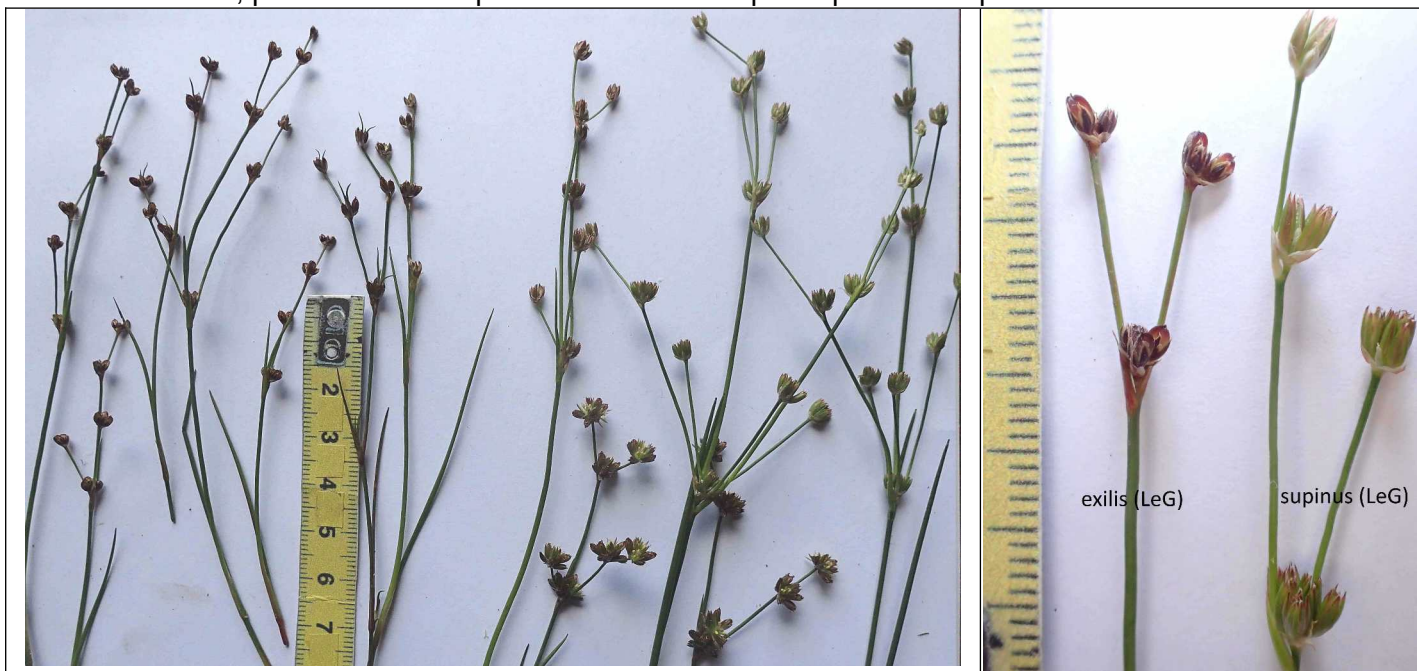
alpha règle (2 intermédiaires?) beta (juin 2021)

Dans la littérature, parfois 2 sous-espèces mais de description quasi incompréhensible.