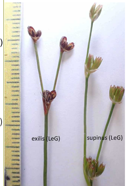
J. supinus agg. in LeG