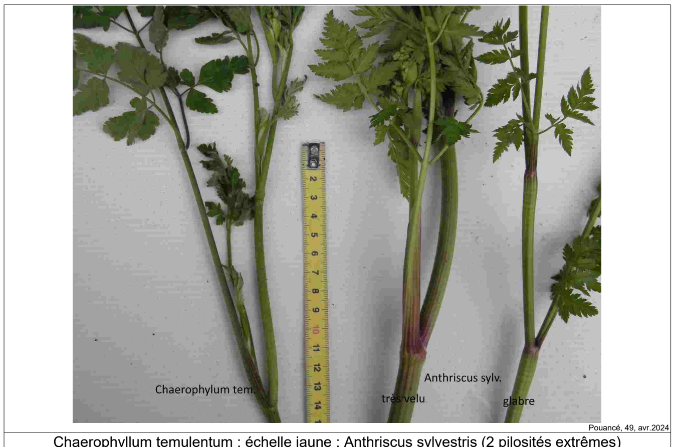
Chaerophyllum temulentum ; échelle jaune ; Anthriscus sylvestris (2 pilosités extrêmes)