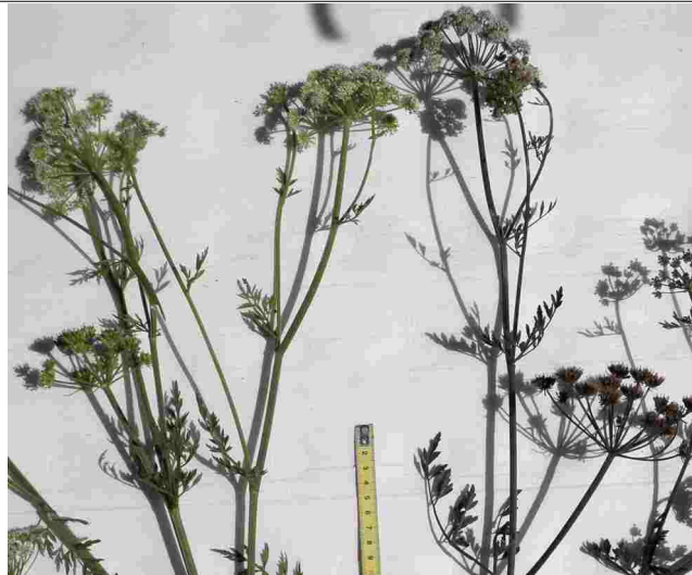
Oenanthe crocata , mi anthèse, 2 individus: sans rose - échelle - individu teinté de rose(tige, fleurs, fruits jeunes)